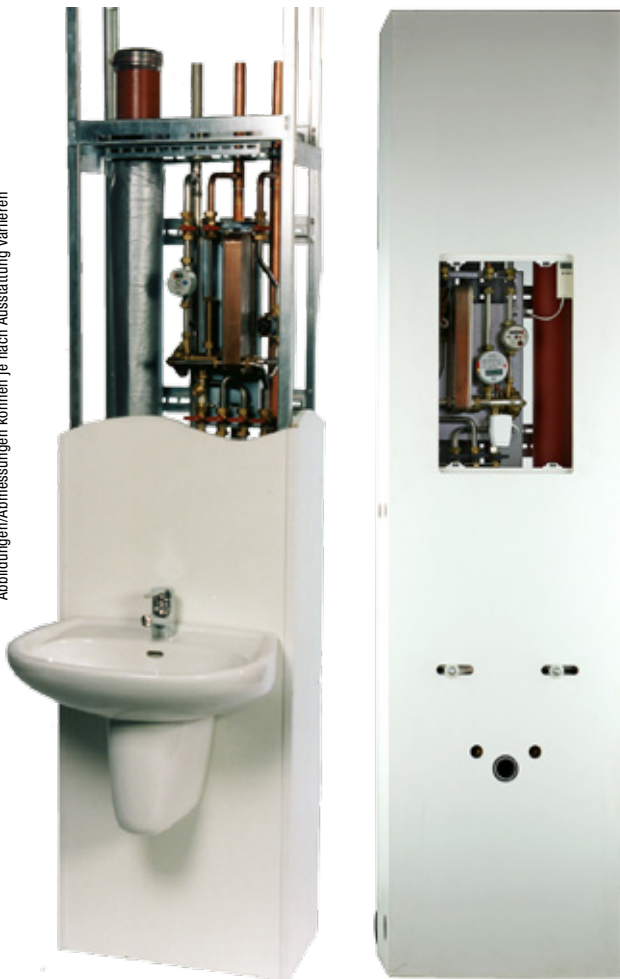
verkleideter Register mit integrierter Wohnungsstation, links mit Vorwandelement (Sanitär)

Abbildungen/Abmessungen können je nach Ausstattung variieren